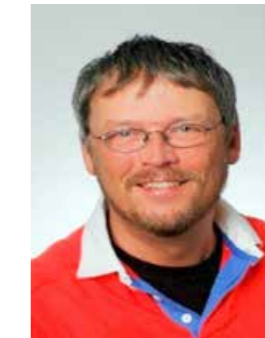
Autor: Dr. Harald Lucius, Gammellund

tem Erbrechen, Fieber, starker Benommenheit oder gar beim Auftreten neurologischer Symptome wie Krampfanfällen. Auch sollte man aufmerksam sein, wenn zum ersten Mal im Verlauf einer Kopfschmerzkrankung neurologische Ausfallerscheinungen auftreten (Gangstörungen, Lähmungen, Missempfindungen, ungewohnte Hirnnervenausfälle). Zum Glück sind diese Kopfschmerzen selten.