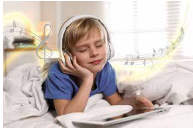
Musiktherapie führt zur Entspannung und kann die Wirkung anderer Therapien verstärken.

Oft spielen psychische und soziale Faktoren eine wichtige Rolle in der Entstehung, Aufrechterhaltung und Verschlechterung chronischer Schmerzen bei Kindern.