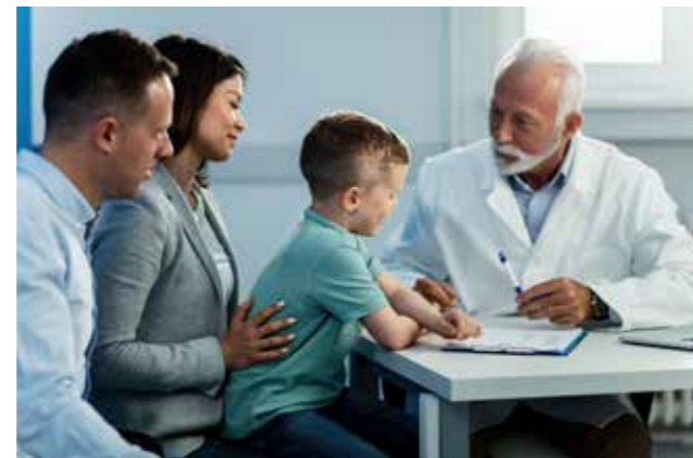
In der Kinderheilkunde wird die ganze Familie behandelt.

In der Erwachsenenversorgung ist der Patient der Hauptansprechpartner von Ärzten, Psychologen und