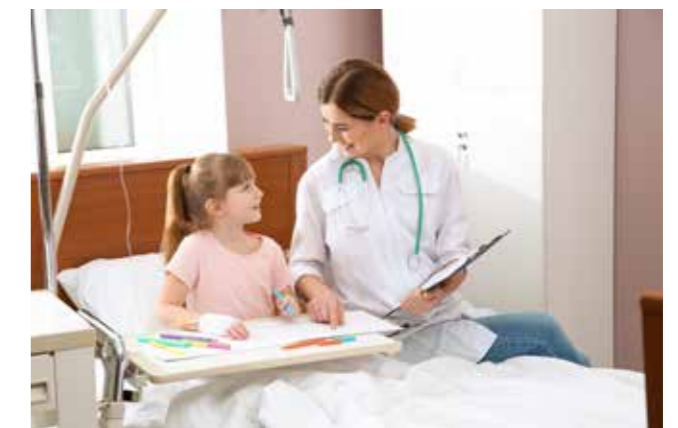
Nach einer drei- bis vierwöchigen intensiven stationären Therapie haben 60% der Patienten überhaupt kein Problem mehr mit chronischen Schmerzen.

Um Schulkindern und Jugendlichen chronische Schmerzen leicht und locker und mit Spaß zu erklären (bei Kindern spielt der „Fun“-Faktor eine größere Rolle als bei Erwachsenen) haben wir den Film „Den Schmerz verstehen – und was zu tun ist in 10 Minuten!“ ( https://www.deutsches-kinderschmerzszentrum.de/ueber-uns/videos/den-schmerz-verstehen/ ) produziert. Der Film nutzt eine verständliche Sprache und eingängige Bilder, um zu erklären, wie sich akute von chronischen Schmerzen unterscheiden, wie chronische Schmerzen entstehen und was man dagegen tun kann. Er ist über die Internetseite des Deutschen Kinderschmerzszentrums kostenfrei verfügbar. Besonders interessierte Eltern und Kinderärzte können dem kostenlosen wissenschaftlichen Begleitheft weitere Informationen entnehmen (Zernikow and Wager, 2014). Zudem halten wir den Film in vielen verschiedenen Sprachen, unter anderem in Türkisch und Arabisch, vor.