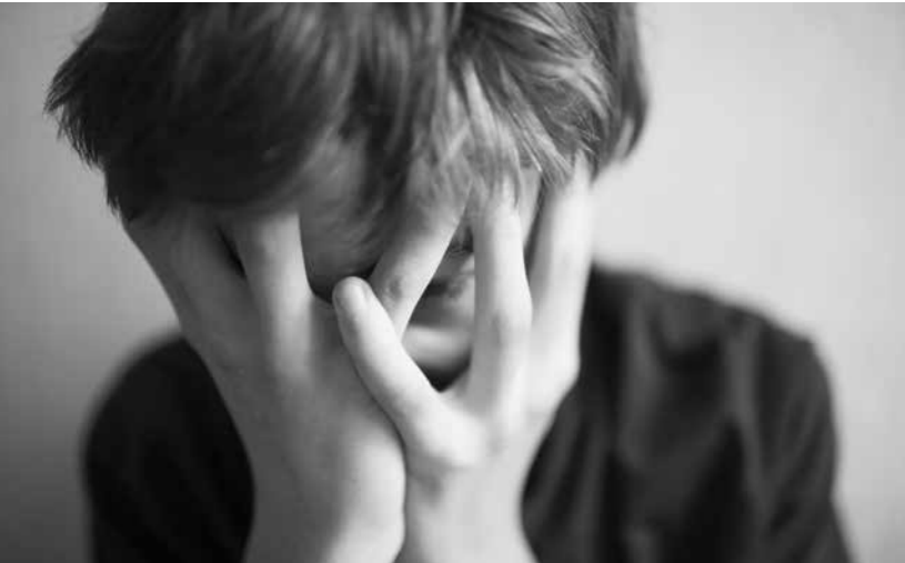
Spannungskopfschmerz äußert sich durch dumpf-drückenden, ziehenden Schmerz.

3. Trotz Befürchtungen vieler Eltern sind lebensgefährliche Kopfschmerzen bei Kindern sehr selten. In unklaren Fällen sollte ein EEG (Ableitung der Hirnströme) erfolgen, auch eine Kernspintomographie ist hilfreich.